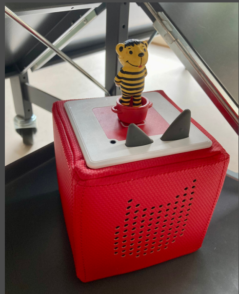
123 Tonies im Bestand