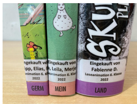
ANIMATION 6. KLASSE; THEMA PARTIZIPATION IN DER BIBLIOTHEK, BZW. SHOPPING ;-)

6 Mal im Jahr besprachen wir zu dritt unsere bibliotheksinternen Themen.