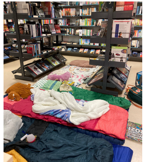
Lesenacht 5. Klasse