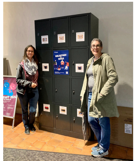
Bildungsreise zur Stadtbibliothek St.Gallen mit der "Bibliothek der Dinge"