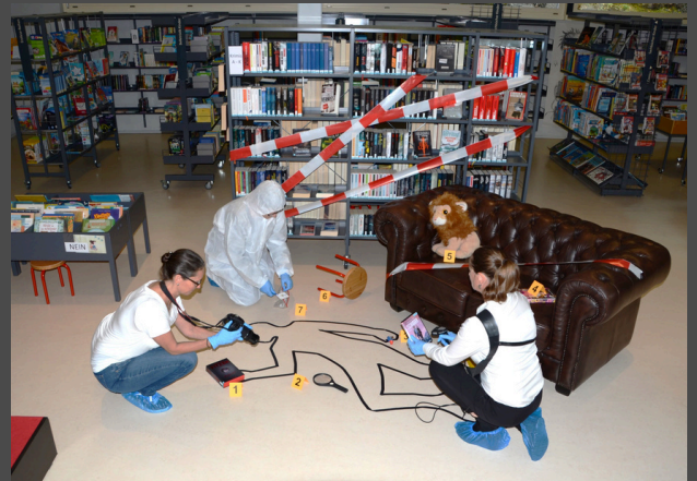
Lesen ist Kino im Kopf! Unser Team sorgt immer für Spannung...