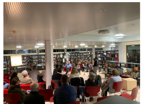
Konzert Musikschule mit Lesung