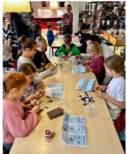
Lego Workshop Christbaumkugeln aus Lego bauen